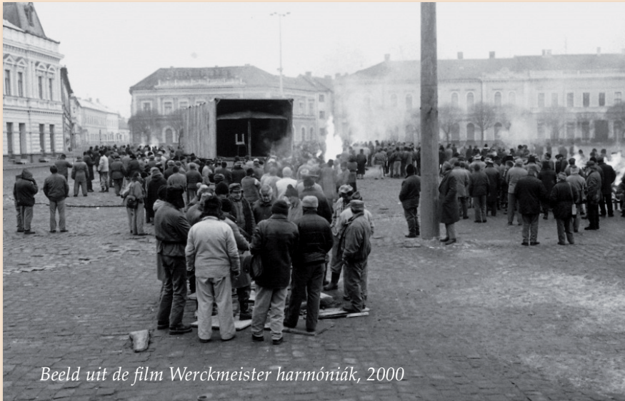
Beeld uit de film Werckmeister harmóniák, 2000

In EYE toont Tarr middels 'gevonden beelden', oorlogsbeelden, fragmenten uit zijn eigen films, rekvisieten en een speciaal voor de tentoonstelling opgenomen nieuwe scène niet alleen zijn sombere wereldbeeld, maar tegelijkertijd zijn mededogen voor de buitengesloten van onze samenleving.